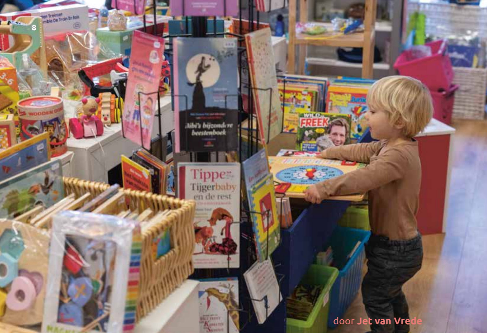
door Jet van Vrede